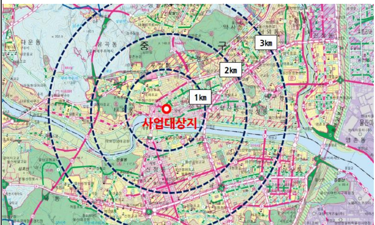
위치도(당산5길 49-4(우정동) 일원)